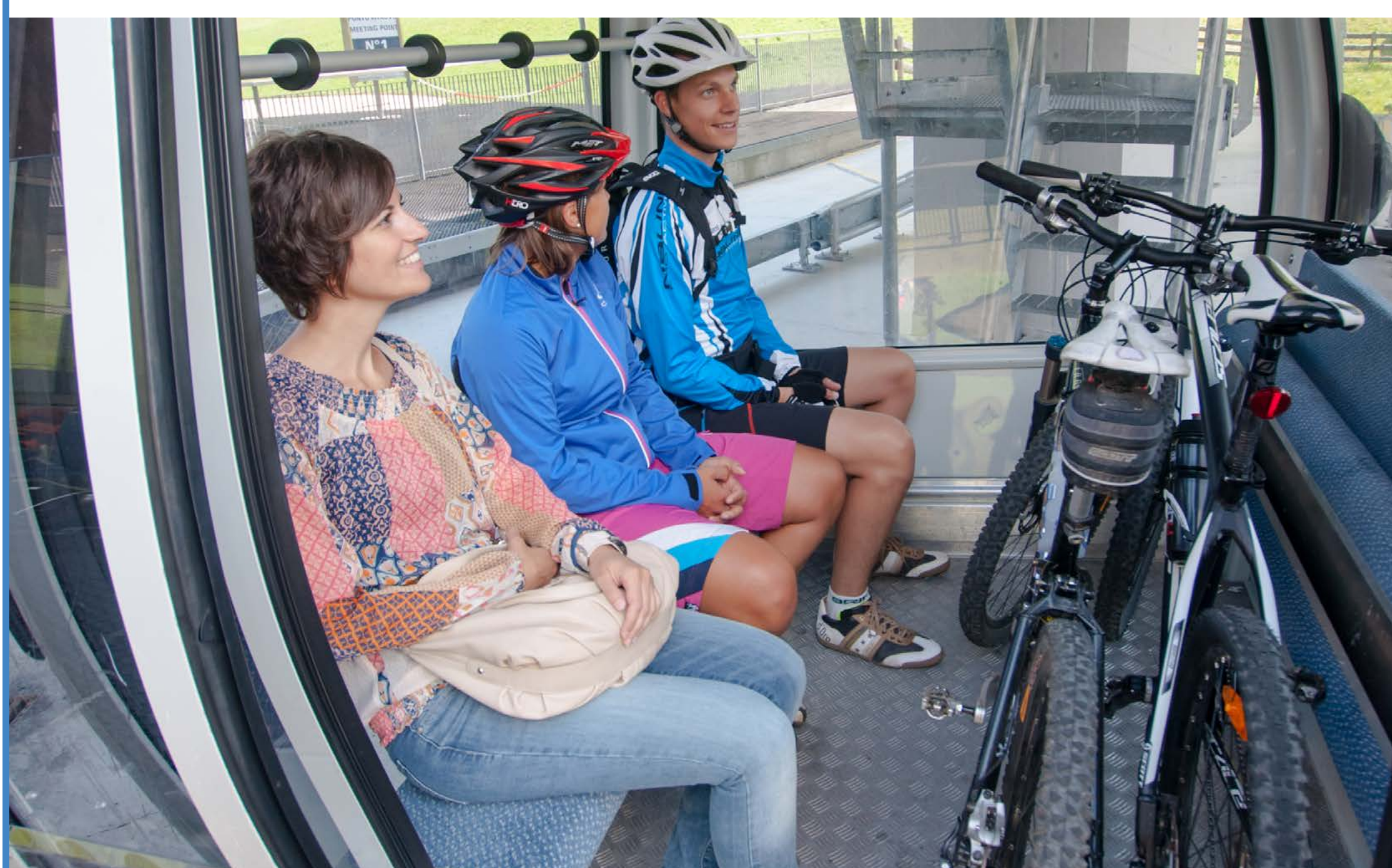
Fahrradmitnahme in einer 8er-Kabine.

1 Quelle: Statistisches Bundesamt/Machbarkeitsstudie Seilbahn Venusberg, S. 46